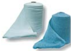
Rollo Bayeta Gris