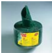
Rollo Scotch Brite