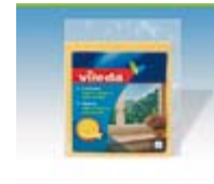
Bayeta Vileda Cristales