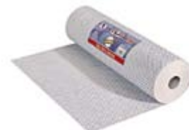
Rollo Bayeta Cruces