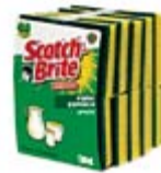
Scotch Brite con Esponja