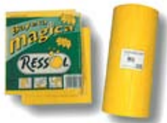
Rollo Bayeta Amarilla